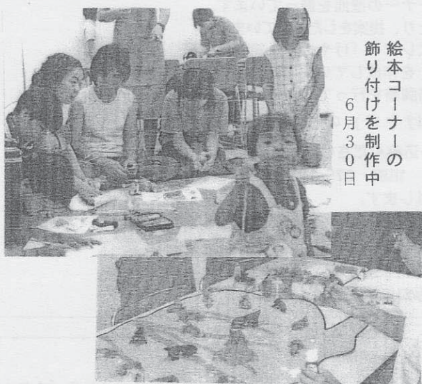
絵本コーナーの飾り付けを制作中 6月30日