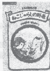
安房直子作 講談社 95年