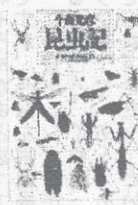
今森光彦写真・文 福音館書店 88年

学生時代に読んだ、懐かしくまた、ユーモアたっぷりの本。中学生以上の皆さん、是非一度お読みください。著者は、豊富な知識と多才さで格調の高い名作群を発表していますが、今回紹介する本は、